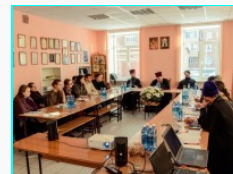
На молодежной секции Рождественских чтений обсудили проблемы