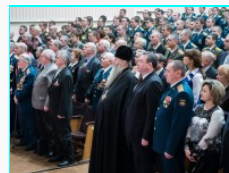
Митрополит Тихон принял участие в праздновании 55-й годовщины...