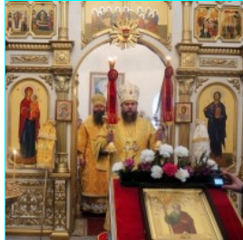
Праздник святого апостола Андрея Первозванного (видео)...