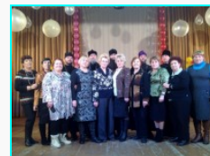
I Рождественские образовательные чтения в Мошковском районе...