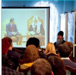
Круглый стол Новосибирских православных СМИ...