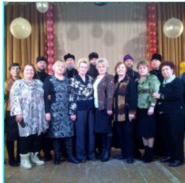
I Рождественские образовательные чтения в Мошковском районе...