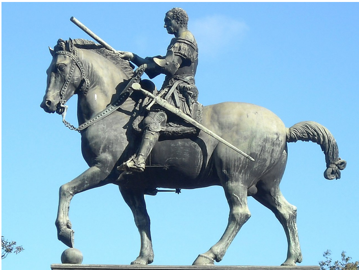
Донателло. Статуя кондотьера Гаттамелаты.